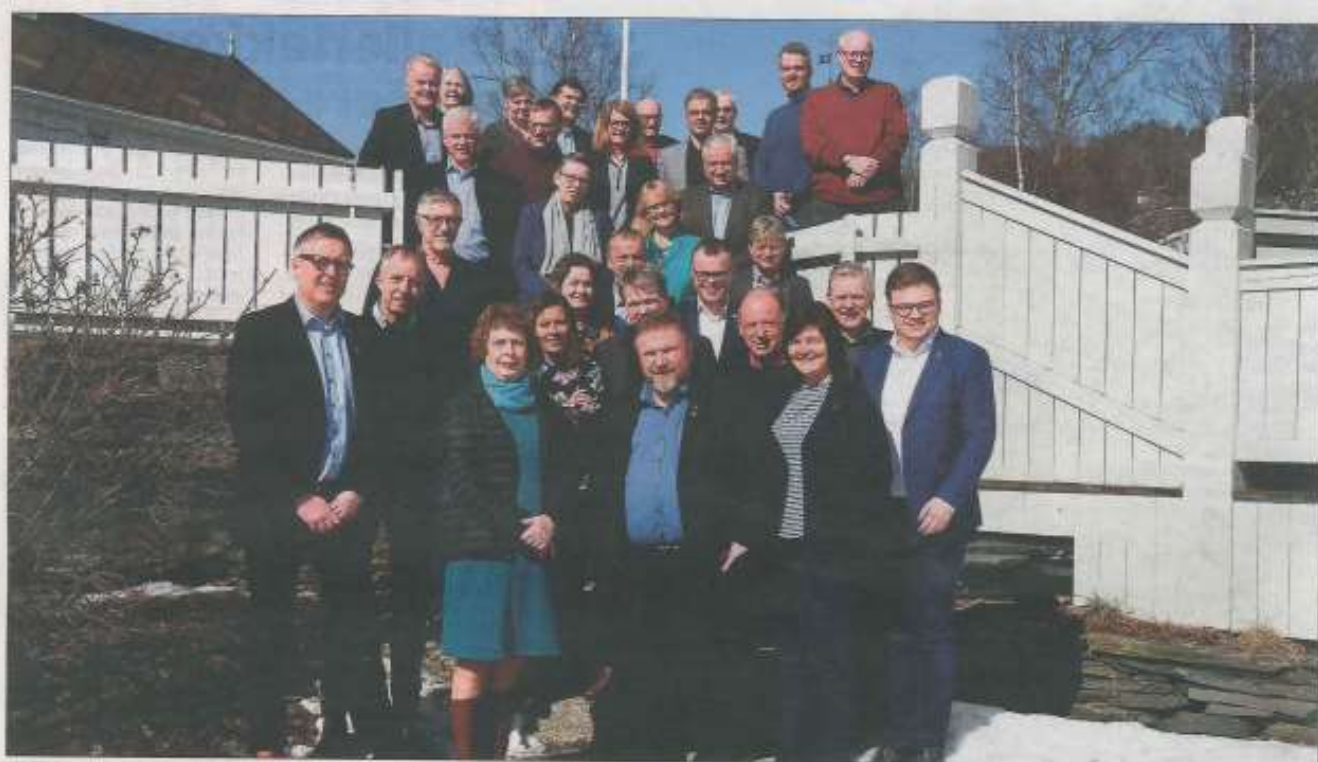
HISTORISK: Ordførere, fylkesordførere, rådmenn og representanter fra fylke og stat var samlet til historiens første Gudbrandsdalsting på Dale-Gudbrands gard.